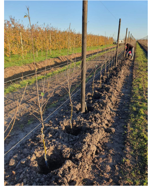
BAUMSTÜTZEN FÜR OBSTBÄUME